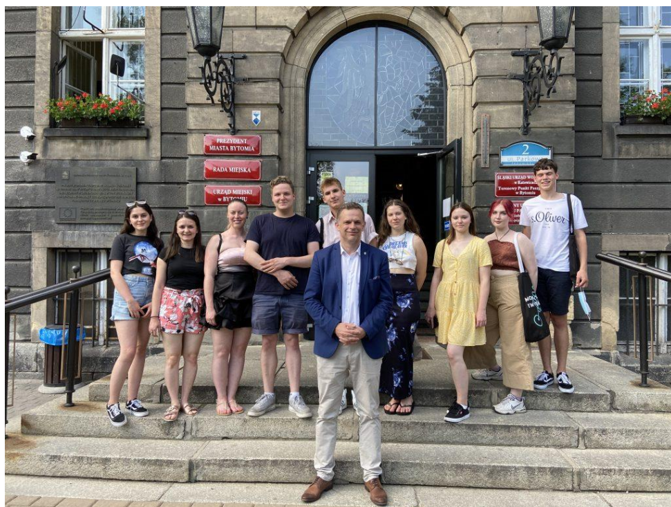
Stretnutie so zástupcom primátora mesta Bytom